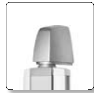
Wandbefestigung mit Drehfunktion.