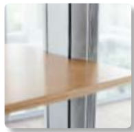
Alle technischen Geräte im schnellen Zugriff – Ablagebord und Box bieten Stauraum und Flexibilität.