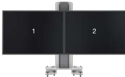
SMS Multi Control Dual Clamp

Vollständige Modellübersicht mit Zeichnungen auf www.smartmediasolutions.se