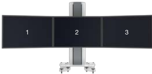
SMS Multi Control Triple Clamp