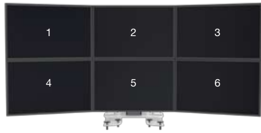
SMS Multi Control 2xTriple Clamp

Zur individuellen Einstellung verfügt das Stativ über stufenlose Regulierung der Winkel zwischen den Bildschirmen.